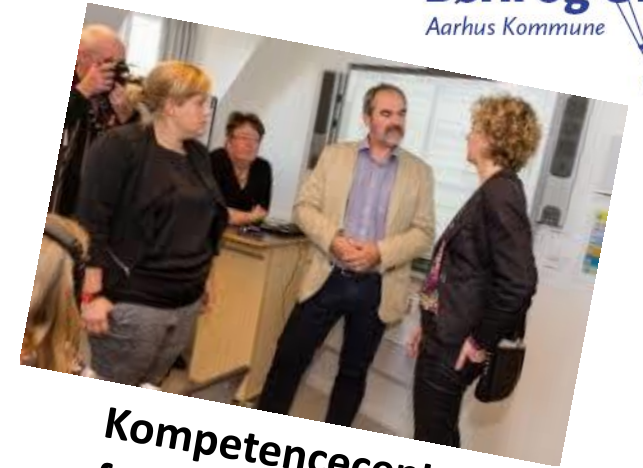
Kompetencecenter for Læsning